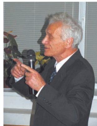
Доклад академика А.В. Гуревича