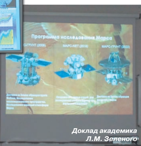
Доклад академика Л.М. Зеленого