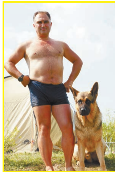
Организаторы: Терихов и Один