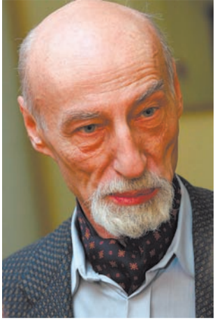
Вячеслав Глазичев , член Общественной палаты Российской Федерации, председатель Комиссии по вопросам регионального развития