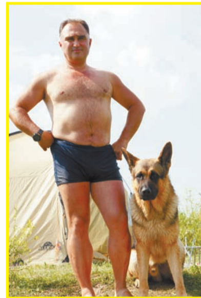
Организаторы: Терихов и Один