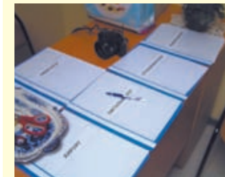
Запись к специалистам