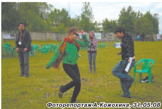
↑ «Гвоздь» программы МАРА