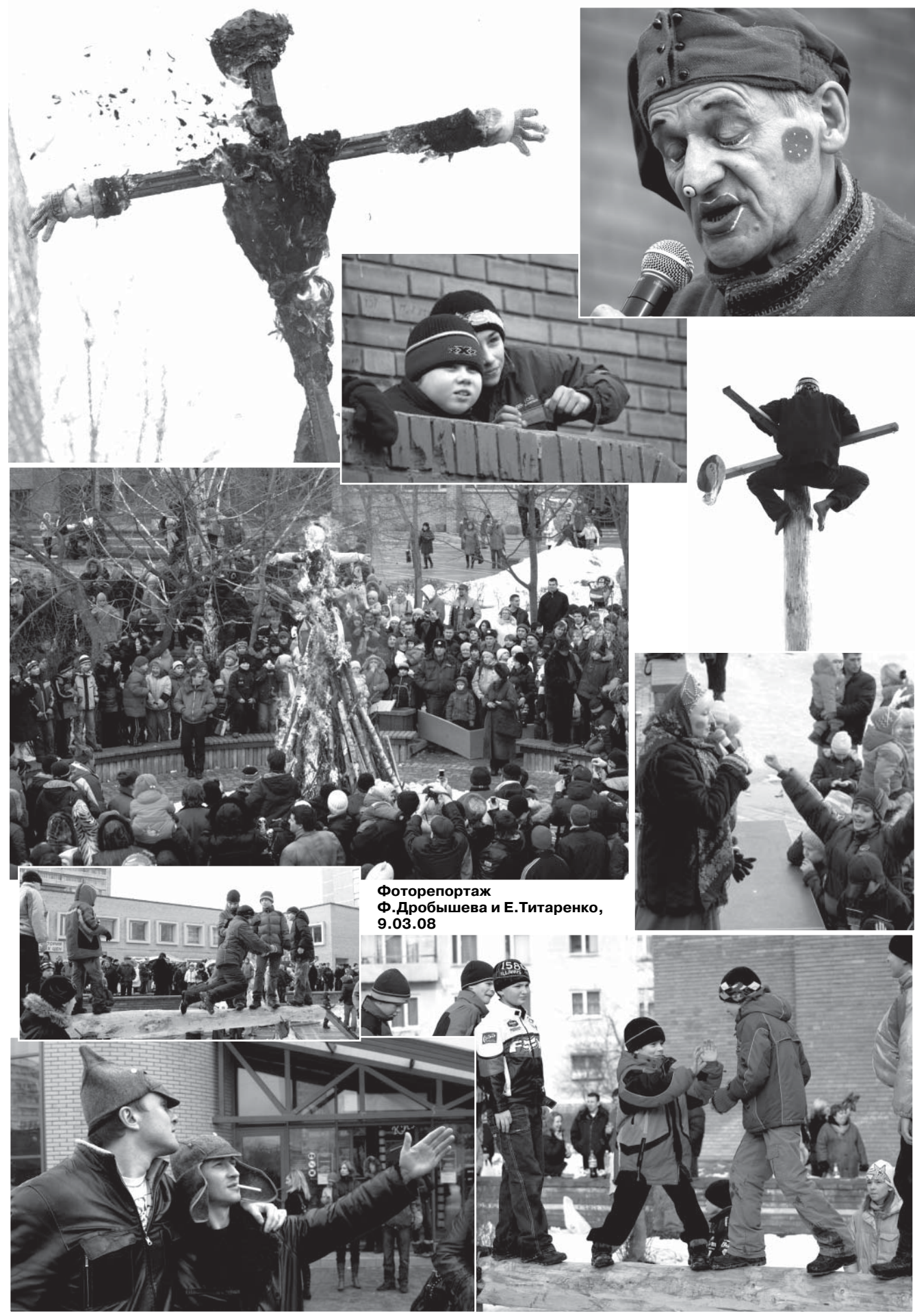
Фоторепортаж Ф.Дробышева и Е.Титаренко, 9.03.08