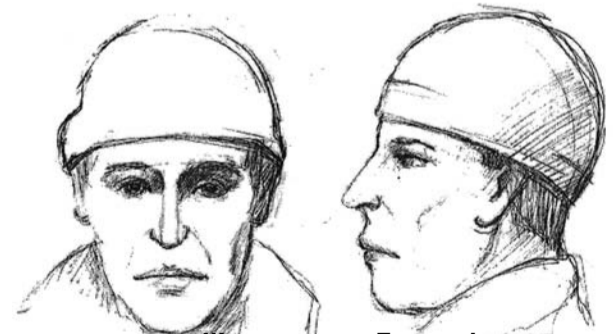
Жители города Троицка!