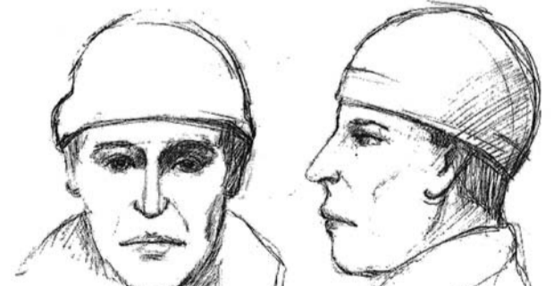
Жители города Троицка!