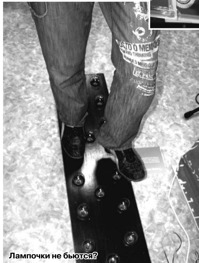
Лампочки не бьются?