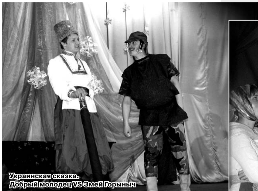
Украинская сказка. Добрый молодец VS Змей Горыныч