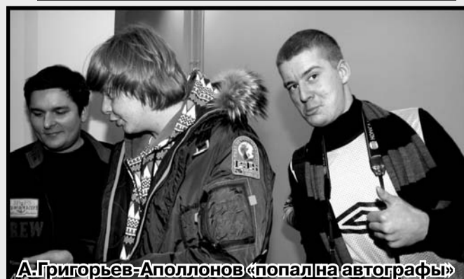
А.Григорьев-Аполлонов «попал на автографы»

5 января в Троицке впервые выступили знаменитые российские поп-исполнители: «Иванушки Int.», «Алёнушки», «Унесённые ветром», Александр Добрынин.