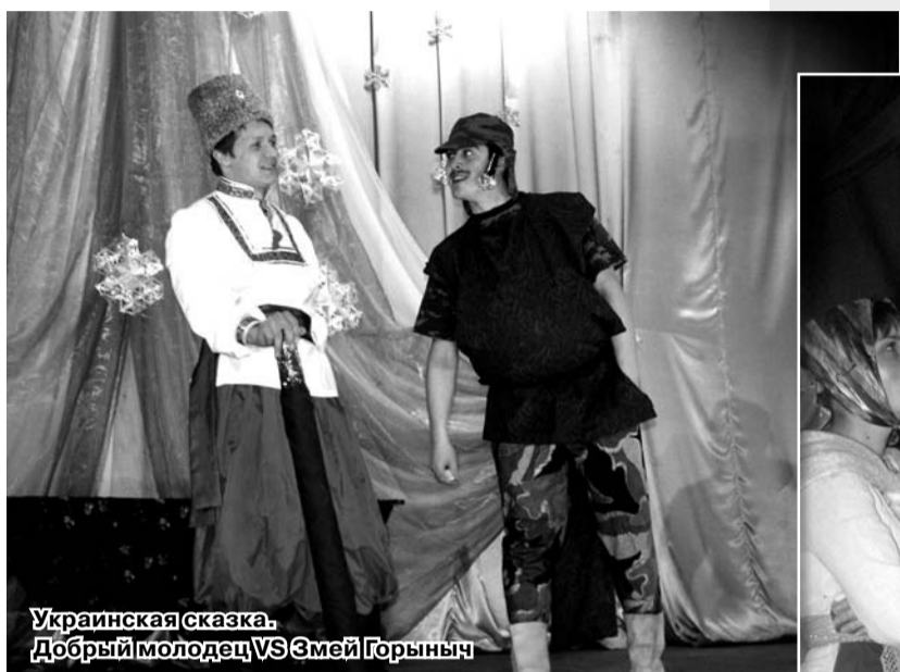
Украинская сказка. Добрый молодец VS Змей Горыныч