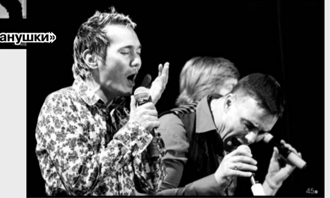
А.Григорьев-Аполлонов «попал на автографы»

5 января в Троицке впервые выступили знаменитые российские поп-исполнители: «Иванушки Int.», «Алёнушки», «Унесённые ветром», Александр Добрынин.