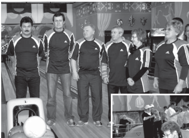
Сборная Совета депутатов