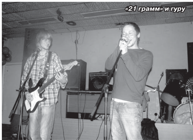
«21 грамм» и гитару