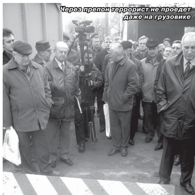
Через препон террорист не проедет даже на грузовике

По материалам пресс-службы Администрации Троицка