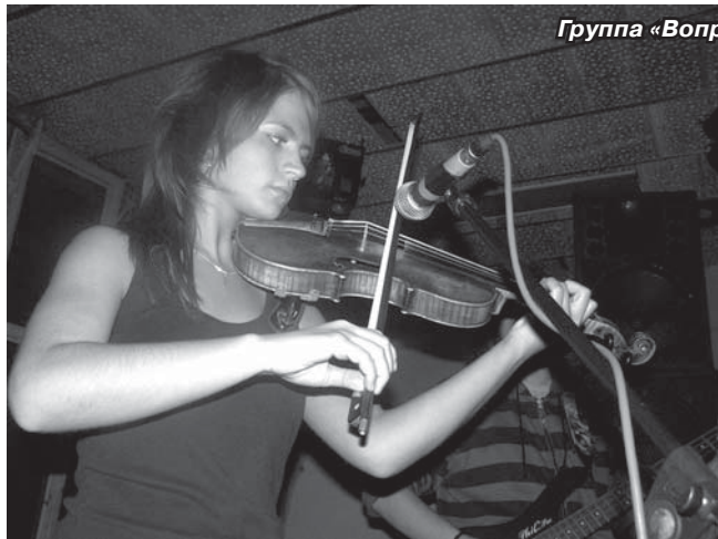
Группа «Вопросы наизнанку»