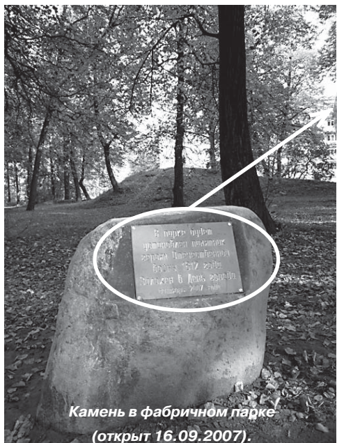
Камень в фабричном парке (открыт 16.09.2007).