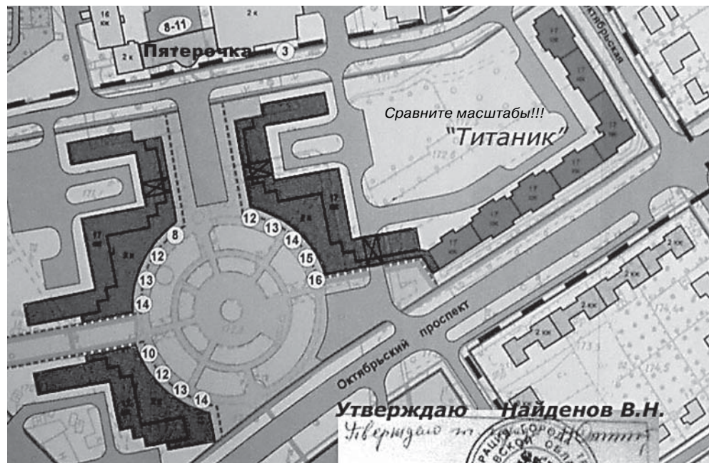
Первоначальный вариант застройки Площади салютов