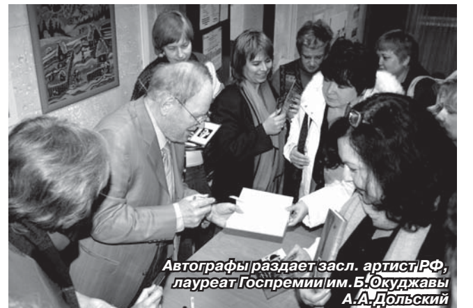
Автографы раздает засл. артист РФ, лауреат Госпремии им. Б.Окуджавы А.А. Дольский