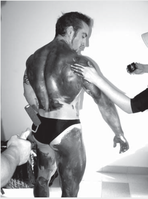
Автозагар. Нужен маляр: спина как стена