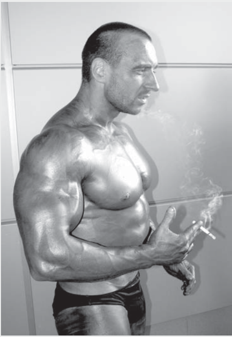
Курение: спасение от голода в двухмесячную диету