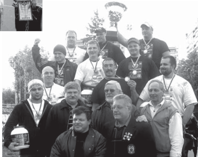
Итоговая таблица первого командного чемпионата Троицка по силовому экстриму «StrongMan» (сборная ДС «Квант» – сборная Троицка, 16 сентября, День города)