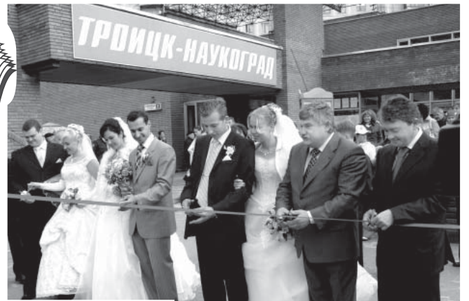
Бульвар открывают: молодожёны, мэр и первый зам: председателя правительства области И.О. Пархоменко

Городская газета • Издается с 1 апреля 1988 г. • № 34 (776)