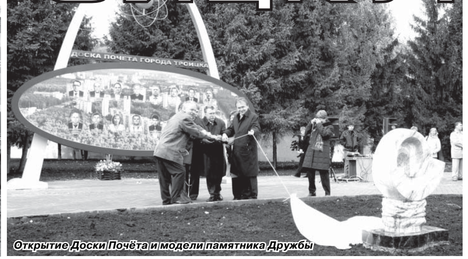
Открытие Доски Почёта и модели памятника Дружбы