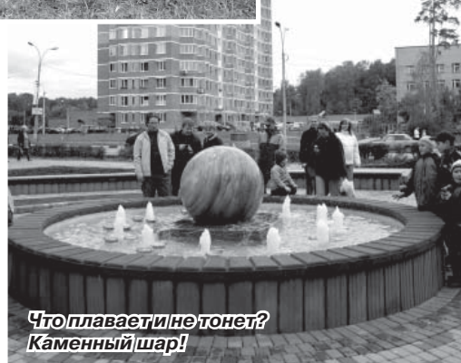
Что плавает и не тонет? Каменный шар!