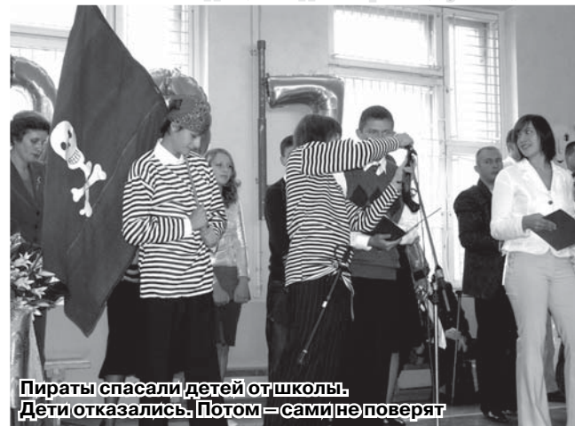
Пираты спасли детей от школы. Дети отказались. Потом — самине поверят

Первое в жизни Первое Сентября. Трудно ощутить весь пафос этого. Первоступнику — от незнания, что такое 10 школьных лет. Родителям — от ироничного отношения к школе: это было давно, было просто, было несерьёзно — в сравнении с тем, что принесла и приносит взрослая жизнь. Но — праздник. Настоящий, не казённо-формальный: в глазах первоклашек — искренность и интерес. Уже в следующий раз они сменятся привычкой и некоторым цинизмом. Но не сегодня. Ощущения первого в жизни Первого Сентября — то, что бывает только раз. И забывается.