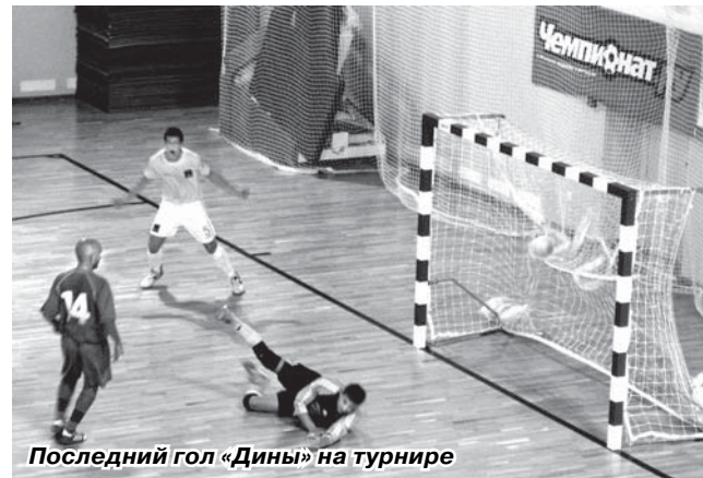
Последний гол «Дины» на турнире

Зато на трибунах уже замечена троичкая молодёжь с атрибутикой и флагами «Дины» и довольно стройной