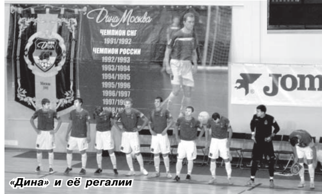
«Дина» и её регалии

В фойе организована торговля сопроводительными товарами. Оперативность их изготовления завидная – в продаже имелись разноцвет-