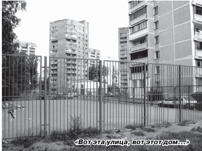
«Вот эта улица, вот этот дом...»