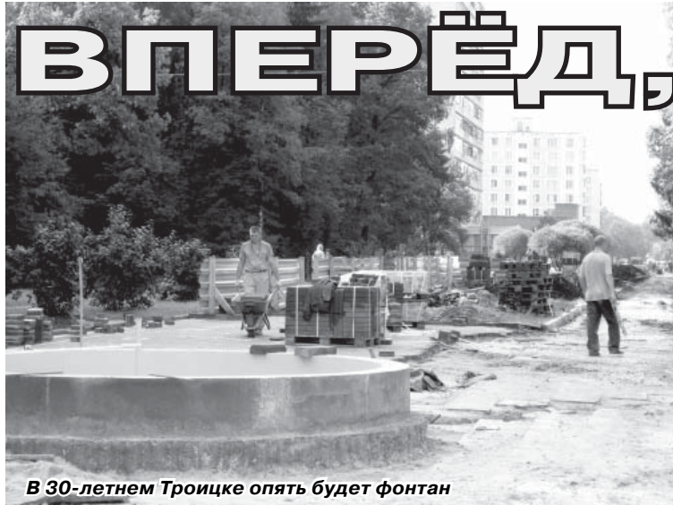
В 30-летнем Троицке опять будет фонтан