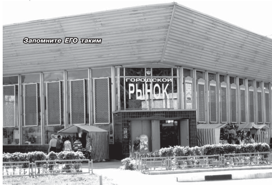
Запомните ЕГО таким

иметь подобное заведение что называется «в шаговой доступности» от места проживания.