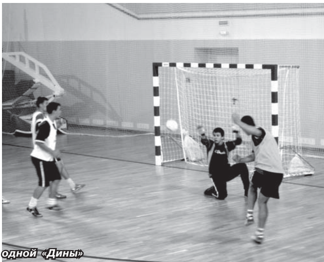
Две стороны одной «Дины»