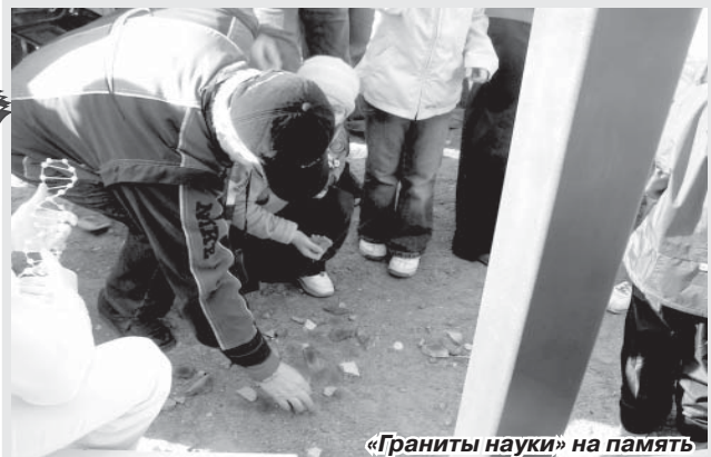
«Граниты науки» на память