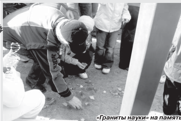
«Граниты науки» на память