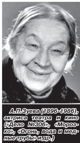
А.П.Зуева (1896-1986), актриса театра и кино («Дело №306», «Морозко», «Огонь, вода и медные трубы» и др.)

Зуева подсаживала, как ехать, я вел в полудурмане машину, припарковался, вышел, открыл заднюю дверцу, помог артистке выйти. Машину НЕ закрыл (!). «Проводишь меня» — я взял ее под локоток, мы вошли в здание... «Будешь ждать здесь, тебя вызовут». Я прошел в очень большую комнату, как оказалось с баром (не алкогольным), и со столиками, и с креслами, и с диванами. Там и сям стояли телевизоры, которые показывали одно — сцену. У меня не было столько денег, как там стоило, даже на воду. Я сел и стал ждать.