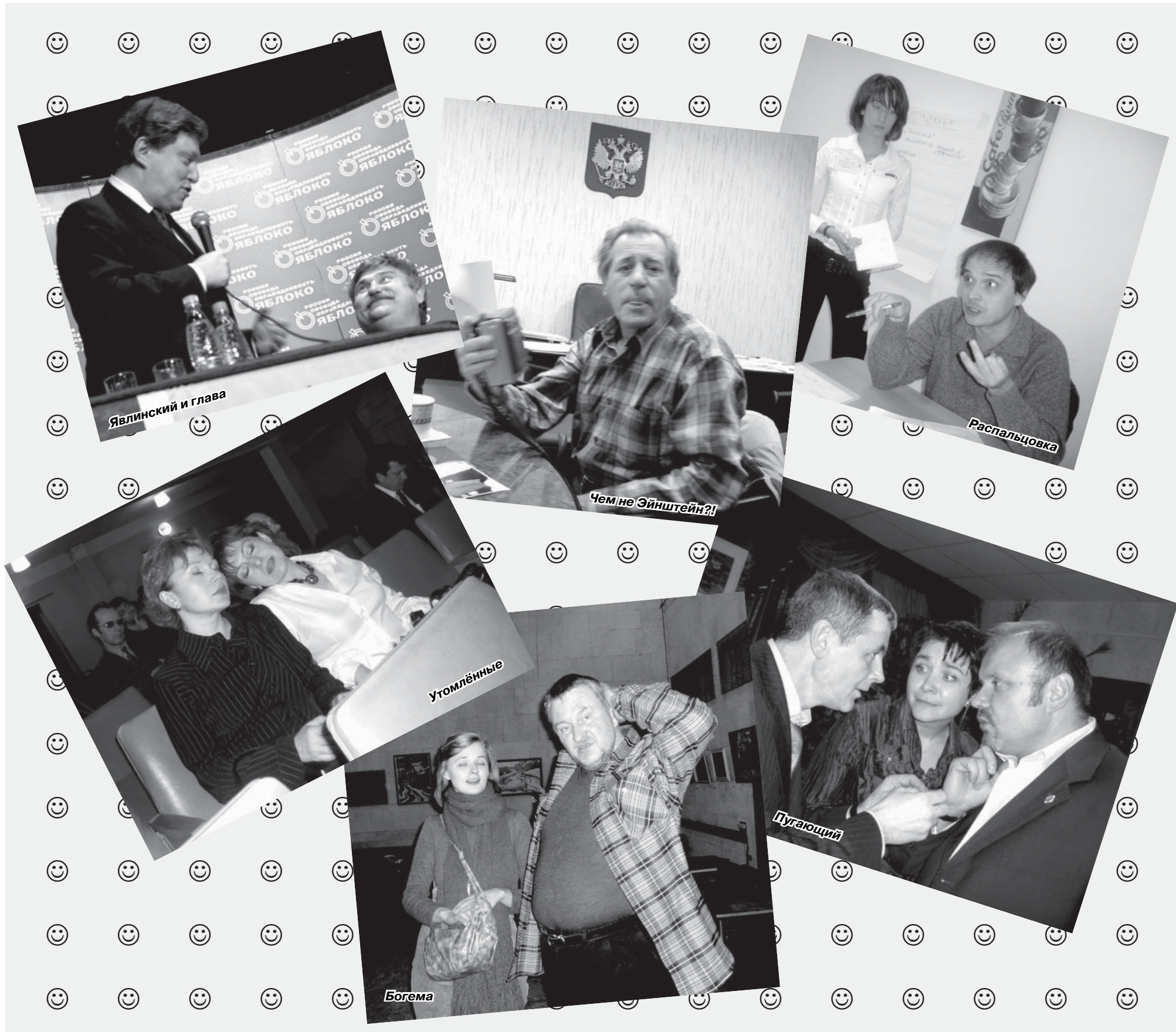
Явлинский и глава