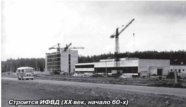
Строится ИФВД (XX век, начало 60-х)