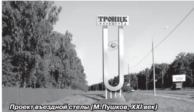
Проект въездной стелы (М.Пушков, XXI век)