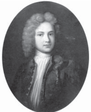
Президент Российской Мануфактур-коллегии Я.М.Евреинов (XVIII век)

1740 – П.Г.Щербатов продал А.Г.Строганову Троицкое «с деревянной церковью св. Троицы»