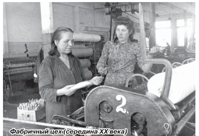
Фабричный цех (середина XX века)