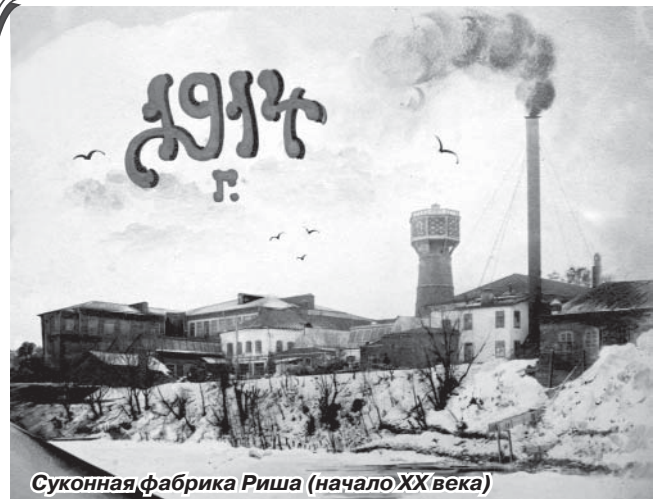
Суконная фабрика Риша (начало XX века)