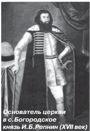
Основатель церкви в с. Богородское князь И.Б.Репнин (XVII век)

1674-1675 – строительство кн. И.Б.Репниным церкви Тихвинской Пресвятой Богородицы и возникновение села Богородского