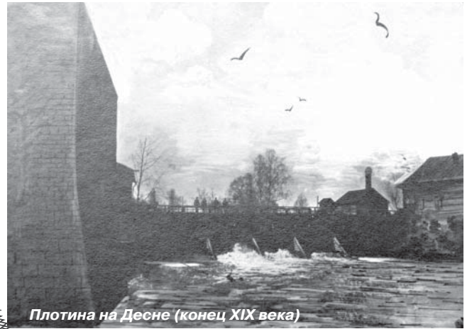
Плотина на Десне (конец XIX века)