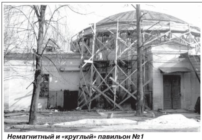
Немагнитный и «круглый» павильон №1