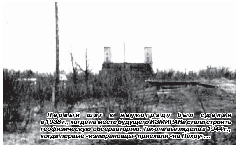
Первый шаг к наукограду был сделан в 1938 г., когда на месте будущего ИЗМИРАНа стали строить геофизическую обсерваторию. Та она выглядела в 1944 г., когда первые «измирановцы» приехали «на Пахру»...

Кстати, кроме престижа и гордости «наукоградство» принесет в наш бюджет, как уже отмечалось на оперативке у главы города, дополнительные «50-60 млн. рублей, и нужно уже сейчас думать, как их потратить с наибольшей пользой...»