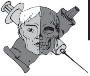
Рис. Д. Матющенко