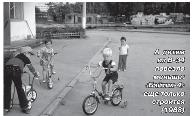
А детям из В-34 повезло меньше: «Байтик-4» еще только строится (1988)