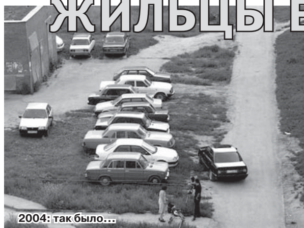
2004: так было...

Завершается асфальтирование и благоустройство территории около В-41. К сожалению, не обходится без эксцессов.