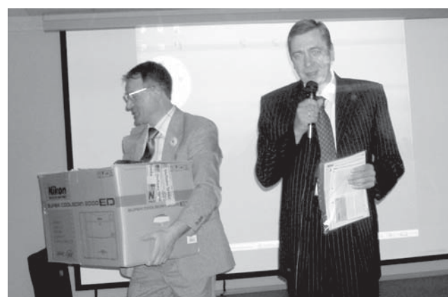
↑ Супер-сканер от «Универстрой»