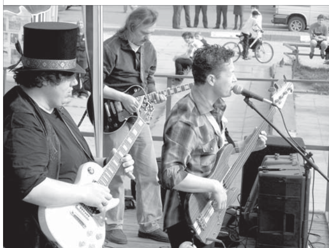
↑ Играет группа «ROCKING'DAD»