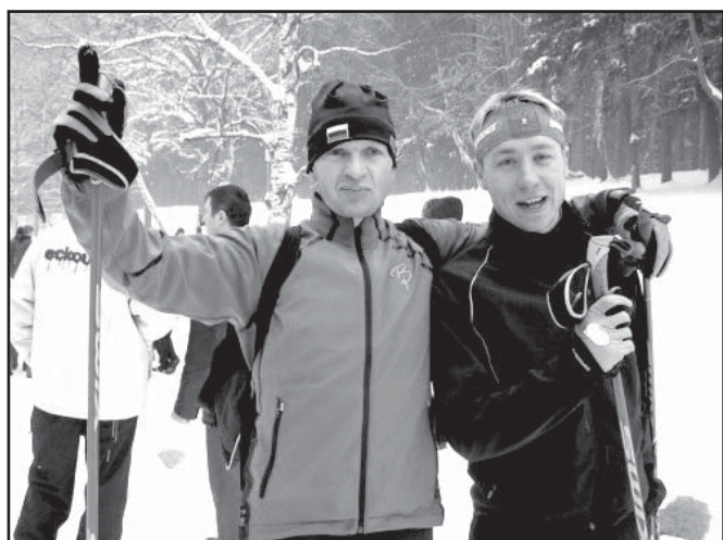
Победители лыжной гонки