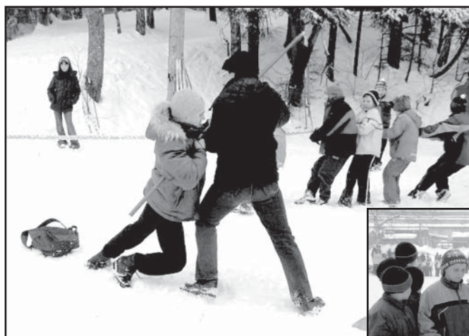
Троицкий вариант сумо