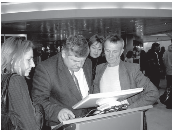
Троицкая делегация пользовалась на выставке НИТ...

другими словами – транспортная схема области.