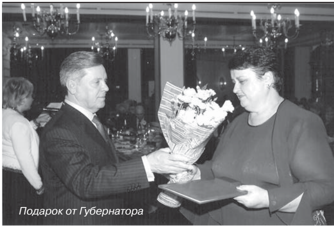
Подарок от Губернатора