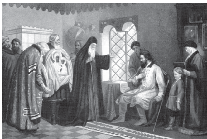
Нижегородские послы у князя Дмитрия Пожарского

Сейчас, как и в начале века XVII, Россия снова на перепутье, снова Отечество наше переживает трудное время. Несколько десятилетий разрушались наши устои, из памяти народа вытравлялись его традиции, была извращена великая и сложная история Госу-