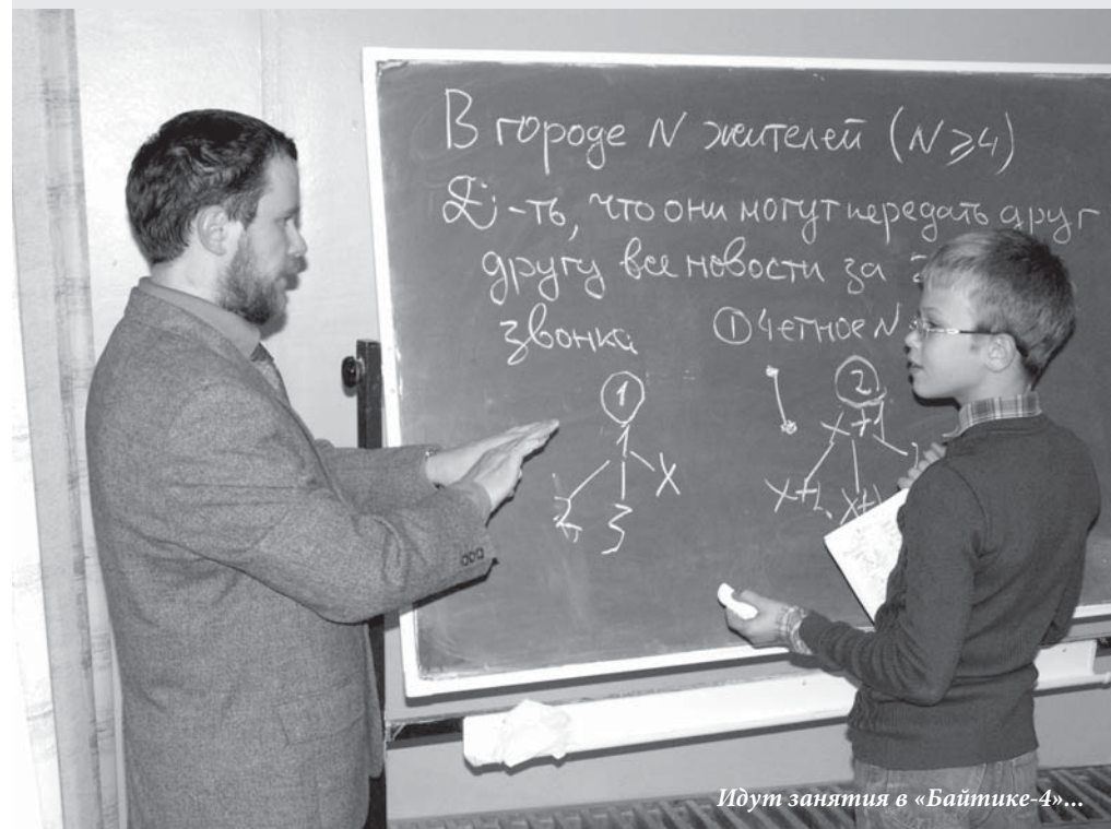
Идут занятия в «Байтике-4»...