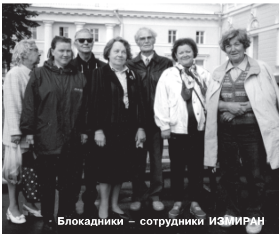
Блокадники – сотрудники ИЗМИРАН