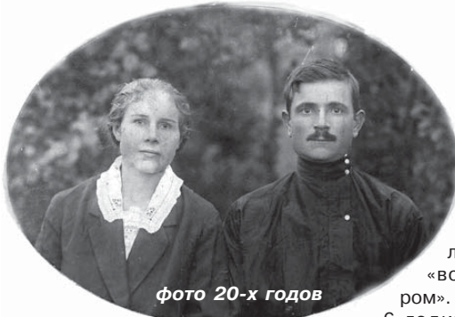
фото 20-х годов