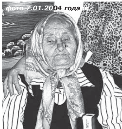
фото 7.01.2004 года