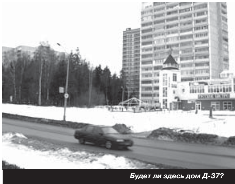
Будет ли здесь дом Д-37?

– сокрытие наличия подписного листа о строительстве; – предъявление его ТОЛЬКО после настойчивой просьбы со словами «если Вы против строительства не возражаете».