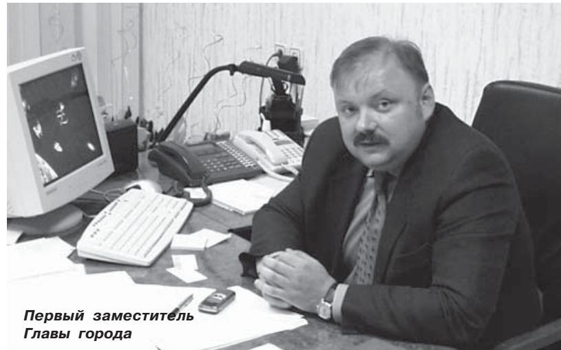
Первый заместитель Главы города

Будет восстановлена химчистка и прачечная на ул.Лесная. Круп-