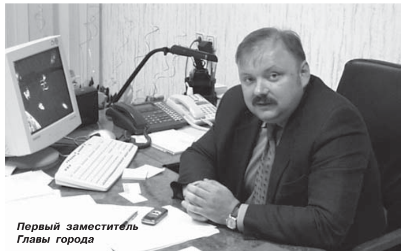
Первый заместитель Главы города