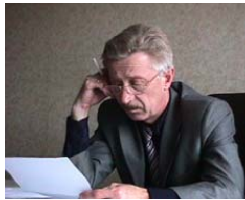
при Найденове и вот теперь при Сидневе. Ну что ж, как говорится, старый конь борозды не портит, посмотрим.