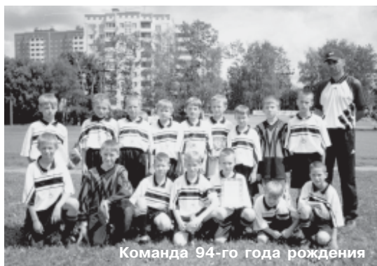
Команда 94-го года рождения

ствами и телевизорами, ходили на экскурсии, общались друг с другом. И удовольствие от времени, проведённого вместе, скрашивало горечь