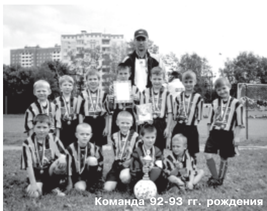
Команда 92-93 гг. рождения

заты, все счастливы. И сами ребята познают ни с чем не сравнимую прелесть быть лучшими, и их родители получают законное право гордиться наследниками, и тренеры видят результаты своего благодарного труда.