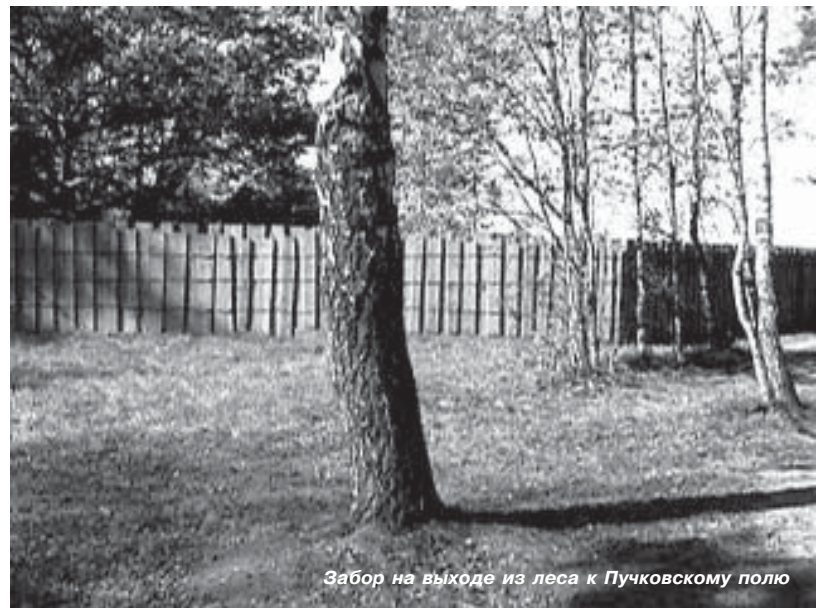
Забор на выходе из леса к Пучковскому полю

вместе с примыкающей к полю дорожкой. Под стук топоров слышна «иностранная речь». Подходы к краю, где раньше грибочки росли, усеяны прикрытыми и не прикрытыми газетами «кучками», горами мусора и прочих бытовых отходов бытия человеческого. Если можно назвать человеческим хамское отношение к природе, тебя произведет. Безмолвна она, не может ответить на весь этот беспредел. Стало мне стыдно, горько, обидно до слез за тебя, человек. Иду дальше вдоль поля, от «пучковской» дороги в глубь леса... И моя обида и горечь начинает перерастать в бешеную ярость. Мы с этой стороны воюем за сохранение оврага — зоны отдыха, которую совершенно точно можно при умелом руководстве сделать престижной (в благородном смысле этого слова), лесного массива для будущего наших с вами детей, ландшафта как такового, экологического равновесия, а «враг» не дремлет, он уже подкрадывается с другой стороны — около гектара леса, моего (вашего) леса, огорожено забором. Честно говоря, я