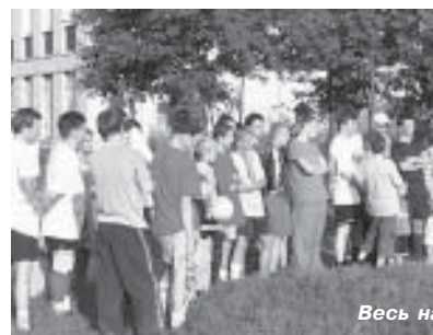
Весь народ, и стар, и мал...

В финальной игре «Абоненты ТТК (мл.)» — «Сотрудники ТТК» лишь за минуту до конца «молодые абоненты» забил два гола и вырвали победу