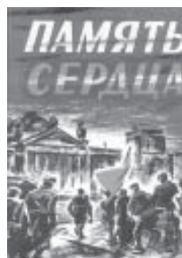
Эрнест КЕМНИЦ, сотрудник ИФВД РАН 9 Мая

Вокруг разлился тихий майский вечер, Лежат поля в покое и тепле, И безмянных памятников свечи Стоят на отдыхающей земле.