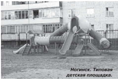
Ногинск. Типовая детская площадка.

Со временем социальная структура общества в городе значительно изменилась: выросло новое поколение, большая часть населения занята в сферах деятельности, связанных с бизнесом, а не с наукой. Идеология развития города в рамках модели наукограда, т.е.