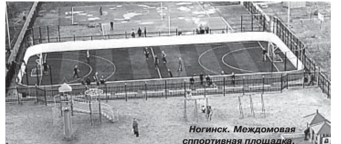
Ногинск. Междомовая спортивная площадка.

Этой зимой я наблюдал ситуацию, как детей из Сергиев-Посада привезли на областную олимпиаду по физике. Детей было человек двадцать. Приехали на двух современных туристических автобусах. Дети выходили из аудиторий с блестящими глазами, тут же собирались вокруг ожидающих их