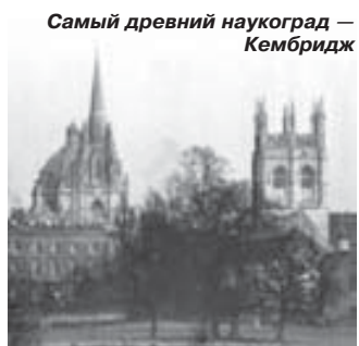
Самый древний наукоград — Кембридж