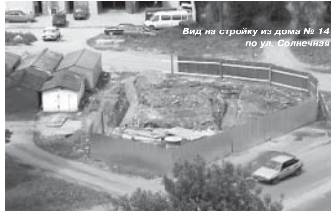
Вид на стройку из дома № 14 по ул. Солнечная

срока действия договора аренды Арендатор имеет преимущественное право на заключение нового договора на тех же условиях.