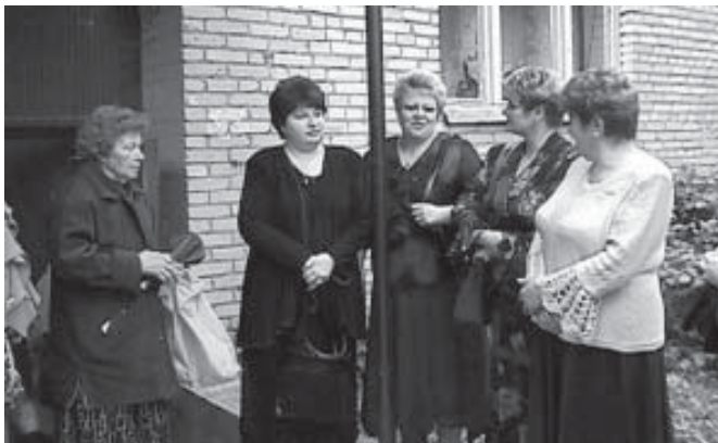
В ожидании начала...