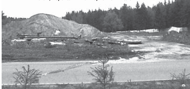
Засыпка оврага в микрорайоне «В» — последняя капля, переполнившая терпение жителей

Н.Н.Сперанский, к.ф.-м.н., сотрудник ТРИНИТИ