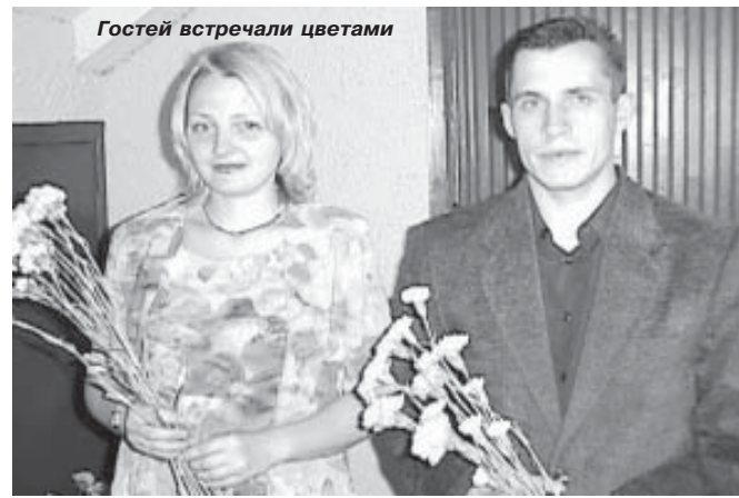
Гостей встречали цветами