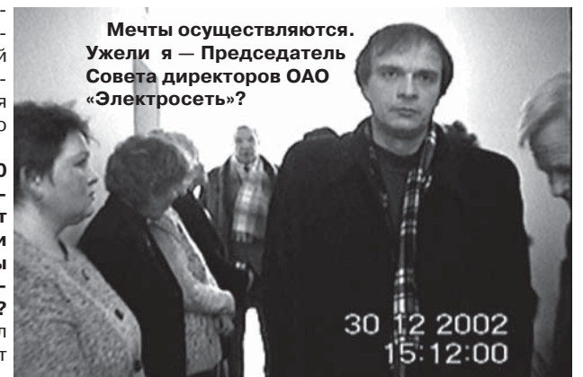
Мечты осуществляются. Ужели я — Председатель Совета директоров ОАО «Электросеть»?

предъявлен тот же самый исполнительный лист.