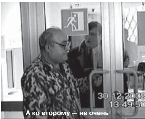
А ко второму — не очень

30 декабря пришло сообщение о начале нового захвата «Троицкой электросети».