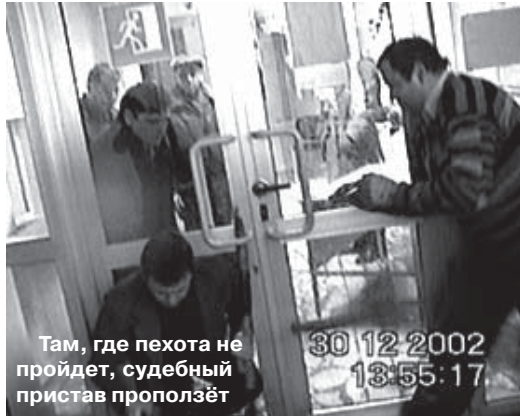
Там, где пехота не пройдет, судебный пристав проползёт

1. В исполнительном документе обязательно должны быть указаны «дело», «материалы», на основании которых «выдан» этот документ, и их номера. Этого нет.