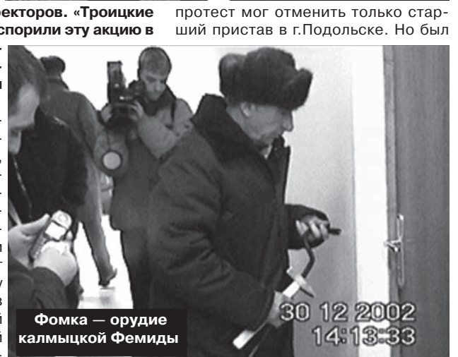
Фомка — орудие калмыцкой Фемиды

протест мог отменить только старший пристав в г. Подольске. Но был