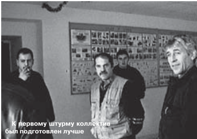
К первому штурму коллектив был подготовлен лучше